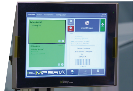
MPERIA Standard simulator softvera trećih strana