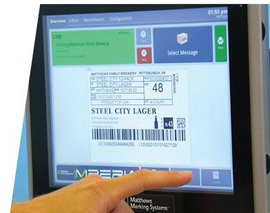
MPERIA Standard i L-Series označavanje